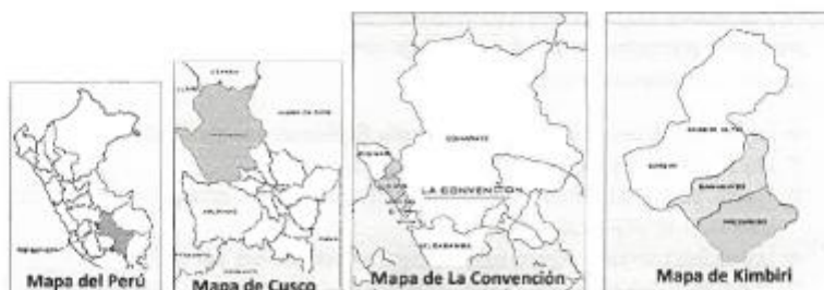
Imagen N° 01: Ubicación localidades beneficiarios en GOOGLE EARTH