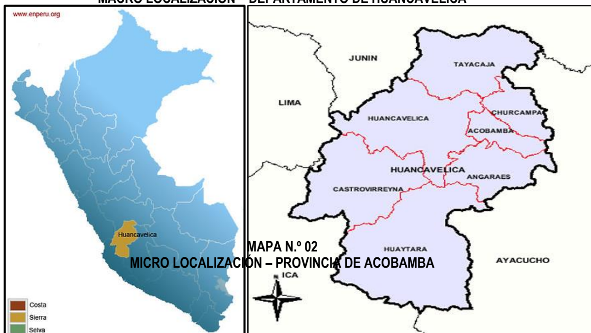
MAPA N.º 01 MACRO LOCALIZACIÓN – DEPARTAMENTO DE HUANCVELICA