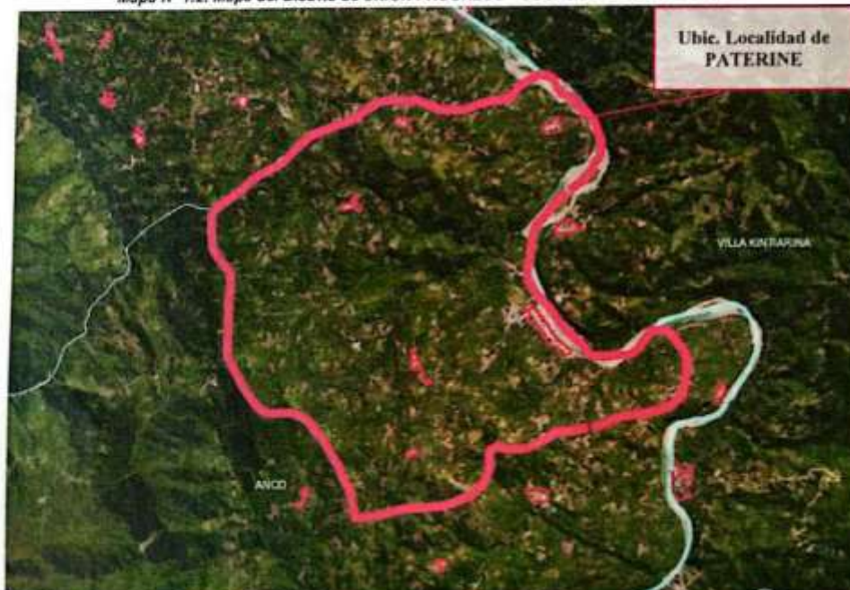
Mapa N° 1.2: Mapa del Distrito de UNION PROGRESO – LOCALIDAD DE PATERINE

Fuente: Geo inversión. Elaboración: Equipo de Trabajo