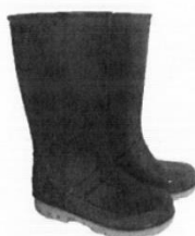
Botas de Jefe