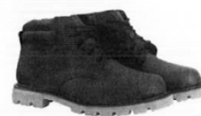
Botines cortos de Jebe