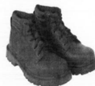
Zapatos de Seguridad con Puntera de Acero