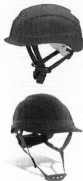
Casco de Seguridad