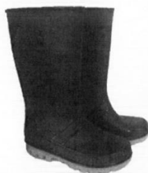
Botas de Jebe