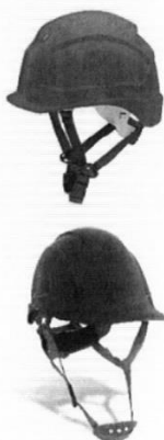
Casco de Seguridad