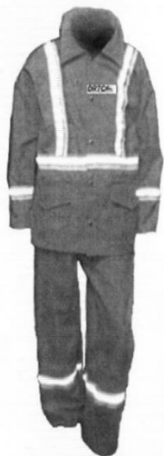
Uniforme de Mantenimiento