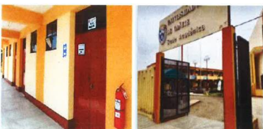
Aulas Escuela Profesional de Turismo y Hotelería de la UNDC