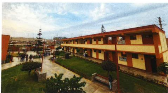
Aulas Escuela Profesional de Turismo y Hotelería de la UNDC