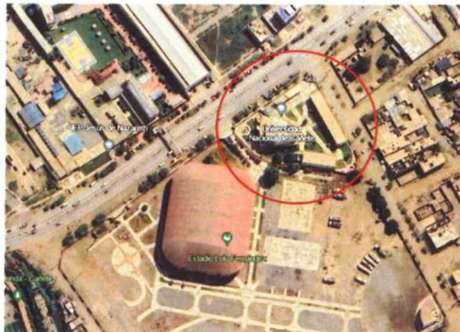
Campus Universidad Nacional de Cañete - UNDC

FOLIO 791: el Postor presente imágenes de una instrucción que no corresponde a la sede donde se plantea la ejecución del proyecto, lo que demuestra que no se verifica la ubicación, con las coordenadas establecidas en el expediente técnico, demostrando que no existe conocimiento del proyecto.