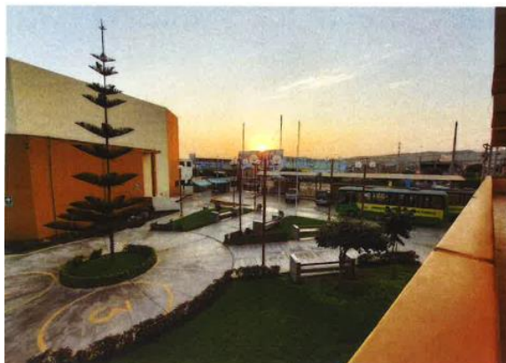
Vista de patio UNDC