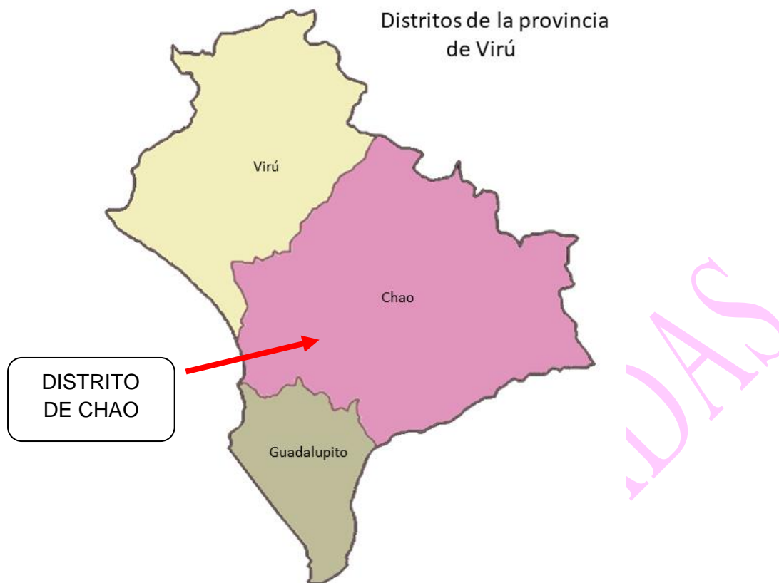
IMAGEN N° 01 UBICACIÓN GEOGRÁFICA