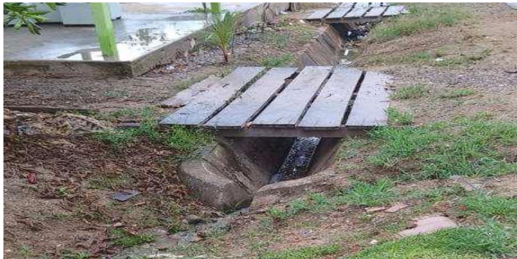
Se observa que la cuneta existente está en pésimas condiciones, debido al deterioro y el crecimiento de malezas