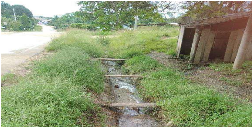
Se observa que la cuneta existente está en pésimas condiciones, debido al deterioro y el crecimiento de malezas

A continuación, se presentan fotografías con las cunetas existentes: