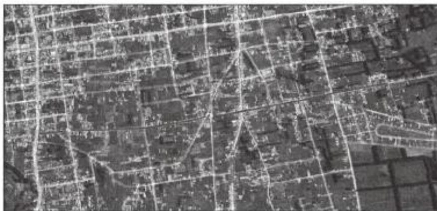
Figura 02. Vía a intervenir Jr. Alfonso Ugarte del distrito de Huancán