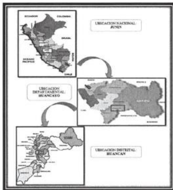
Figura 01. Ubicación Política del distrito de Huancán