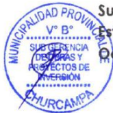
MAPA N° 01: MAPA DE UBICACIÓN DEL PROYECTO