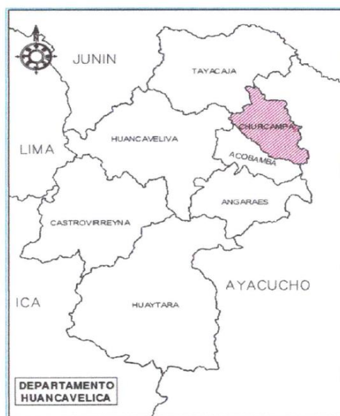
MAPA N° 03: LOCALIZACIÓN DEL PROYECTO