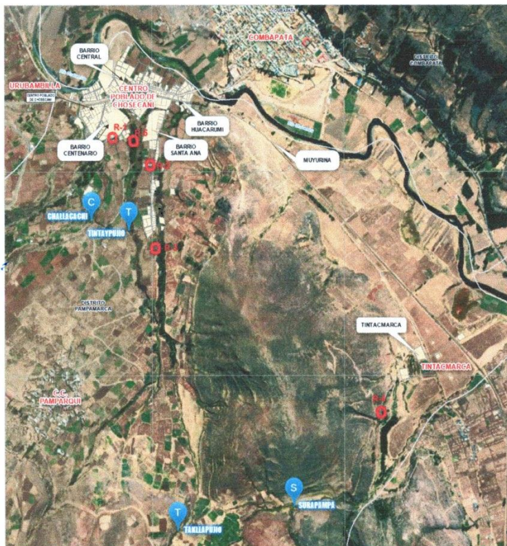
Figura 02 – Área de Influencia del Proyecto