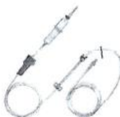
Fig. 1.: Línea para Bomba de Infusión sin Volutrol (No implica diseño)