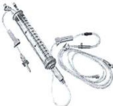
Fig. 1.: Línea para Bomba de Infusión con Volutrol (No implica diseño)