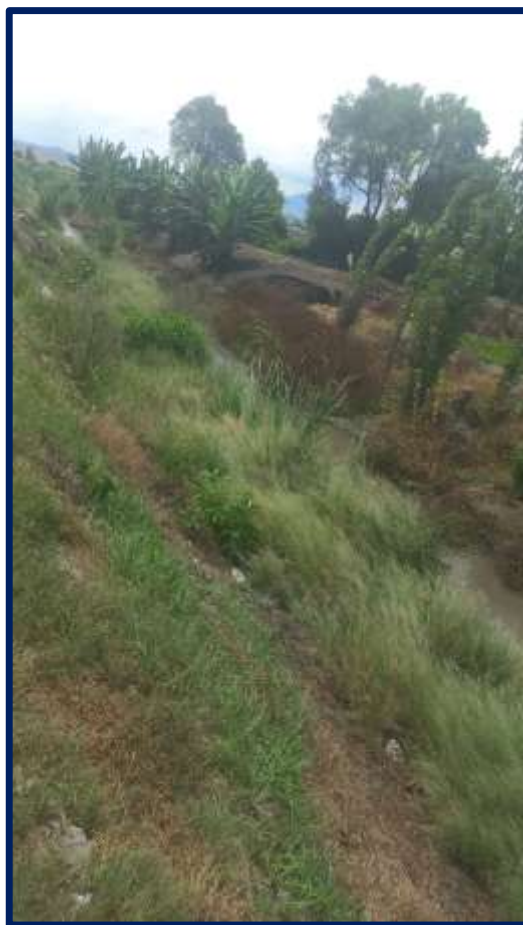
PUNTO INICIAL DEL DREN LAVANDERO