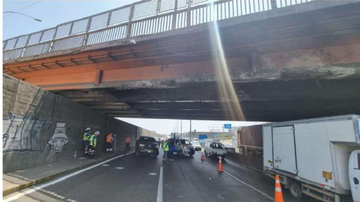
Figura 02.- Vista del estado de las vigas dañadas por el choque (Sentido Norte a Sur).