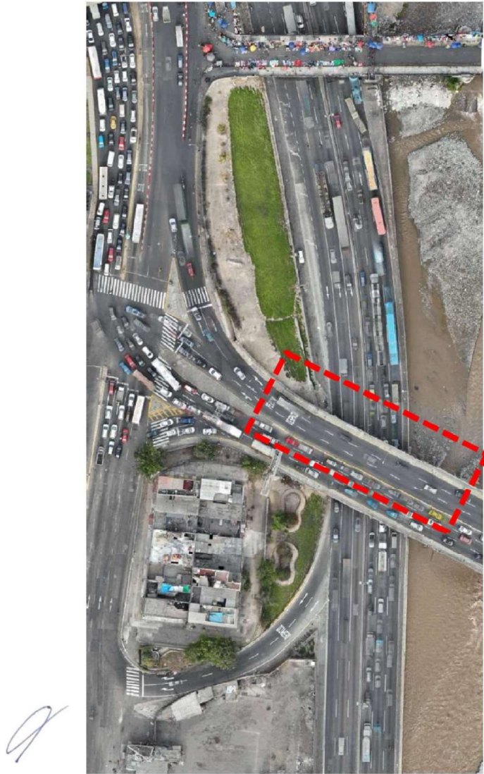
Figura 1: Ubicación del Puente Vehicular Ricardo Palma – Sobre Vía de Evitamiento