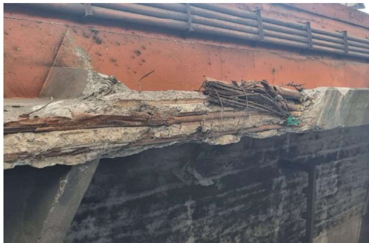
Figura 03.- Vista inferior de la viga exterior del puente hacia el lado sur en sentido norte a sur. Rotura de gran porcentaje de cables postensados por efecto de los choques.