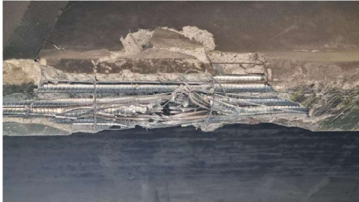
Figura 04.- Vista inferior de la 2da viga del puente hacia el lado sur en sentido norte a sur. Rotura de gran porcentaje de cables postensados por efecto de los choques.