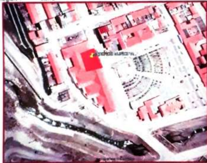
Vista Satelital de la ubicación del área del proyecto

Coordenadas UTM Datum WGS84 Zona 18L Este (X) : 384009.00 Norte (Y): 8718809.00 Altitud : 4262 m.s.n.m. Región : Sierra