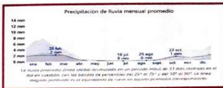
IMAGEN PRECIPITACIÓN DE LLUVIA MENSUAL PROMEDIO

La cantidad de lluvia en un intervalo de 31 días en Morococha no varía considerablemente durante el año y permanece entre 1 milímetros de 1 milímetros.