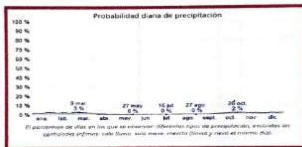
IMAGEN PROBABILIDAD DIARIA DE PRECIPITACIÓN

Entre los días mojados, distinguimos entre los que tienen solamente lluvia, solamente nieve o una combinación de las dos. En base a esta categorización, el tipo más común de precipitación durante el año es solo lluvia, con una probabilidad máxima del 2 % el 4 de marzo.