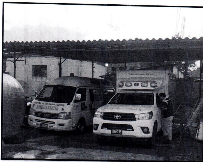
IMAGEN N° 01 Parqueadero insuficiente para todas las ambulancias Fecha 13/03/2024

A continuación, se presenta una muestra fotográfica del estado situacional de la infraestructura del parqueo de ambulancias.