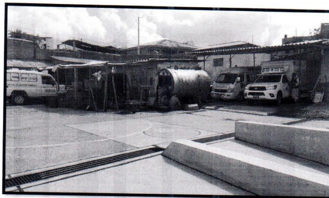
IMAGEN N° 02 Parqueadero de ambulancias Fecha 13/03/2024

"Año del Bicentenario, de la consolidación de nuestra independencia, y de la conmemoración de las heroicas batallas de Junín y Ayacucho"