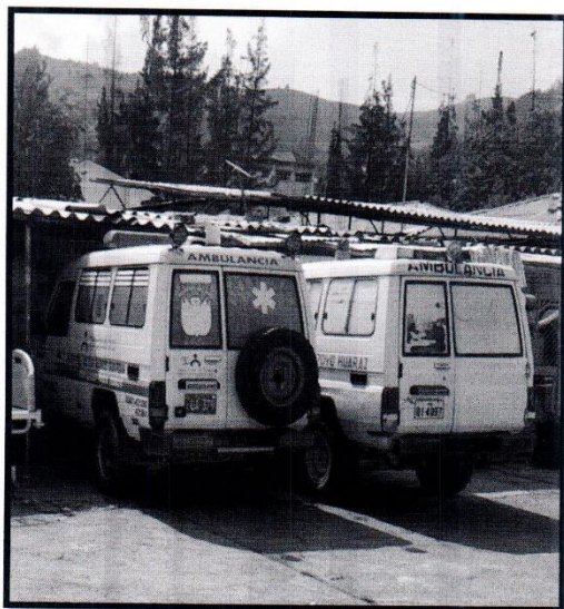
IMAGEN N° 03 Parqueadero inadecuado, cubre solo la mitad de las ambulancias Fecha 13/03/2024