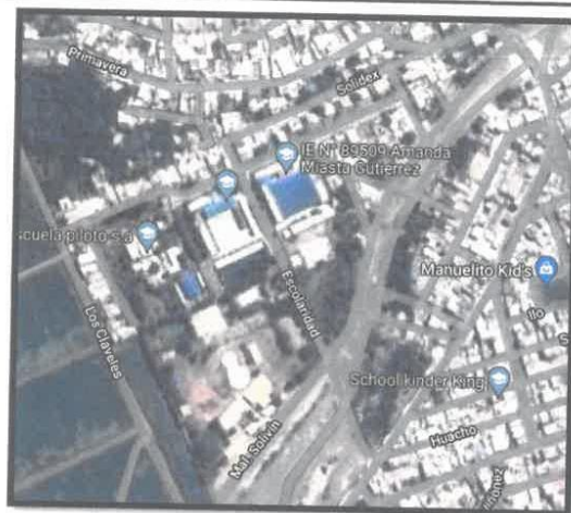
Imagen 01 - Vista satelital de la localización del proyecto.