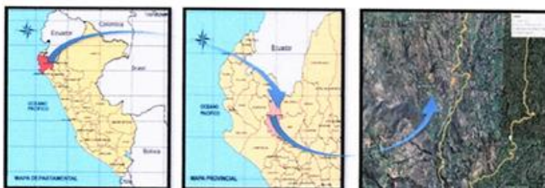
Figura N°01. Ubicación del proyecto a nivel departamental, provincial y Local