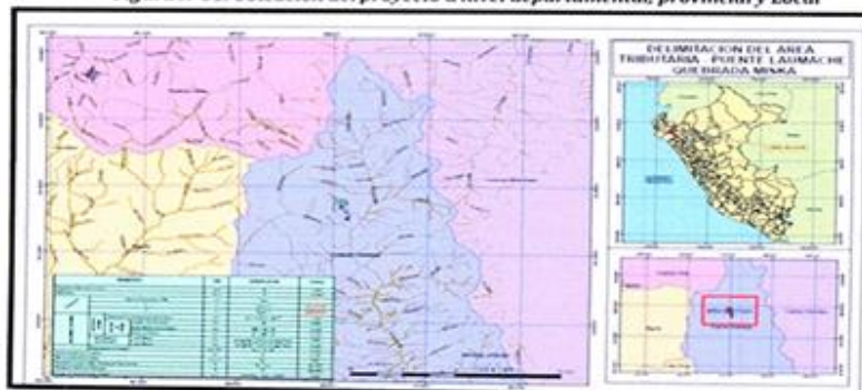
Ubicación del proyecto en la localidad de Huancabamba.