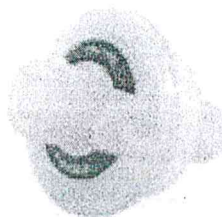
Fig. 1 (No incluye diseño)