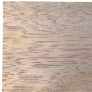
MACHIHEMBRADO(AGUANO)- IMAGEN REFERENCIAL

Año del Bicentenario de la consolidación de nuestra independencia y de la conmemoración de las heroicas batallas de Junin y Ayacucho