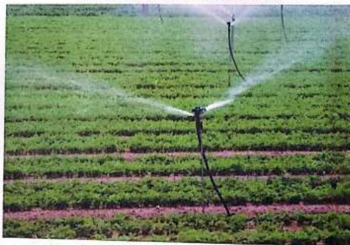
CERRO DE PASCO, MAYO DEL 2025