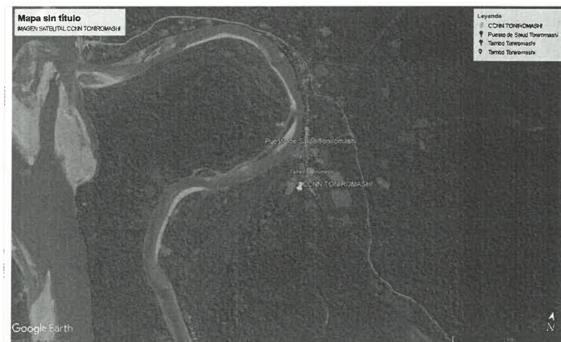
Figura 2: Vista satelital de la Comunidad Nativa TONIROMASHI.