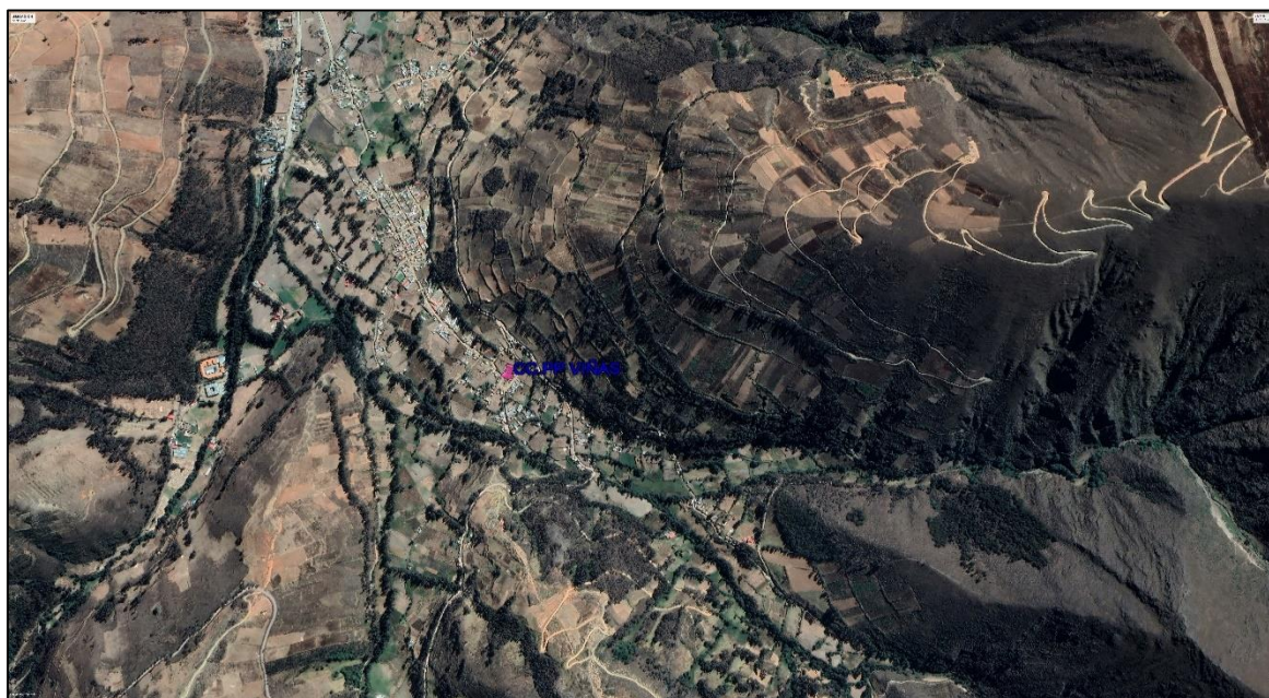
FIGURA N°01: UBICACIÓN DEL CENTRO POBLADO DE VIÑAS