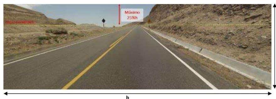
Visualización aceptada (con vista de plataforma)