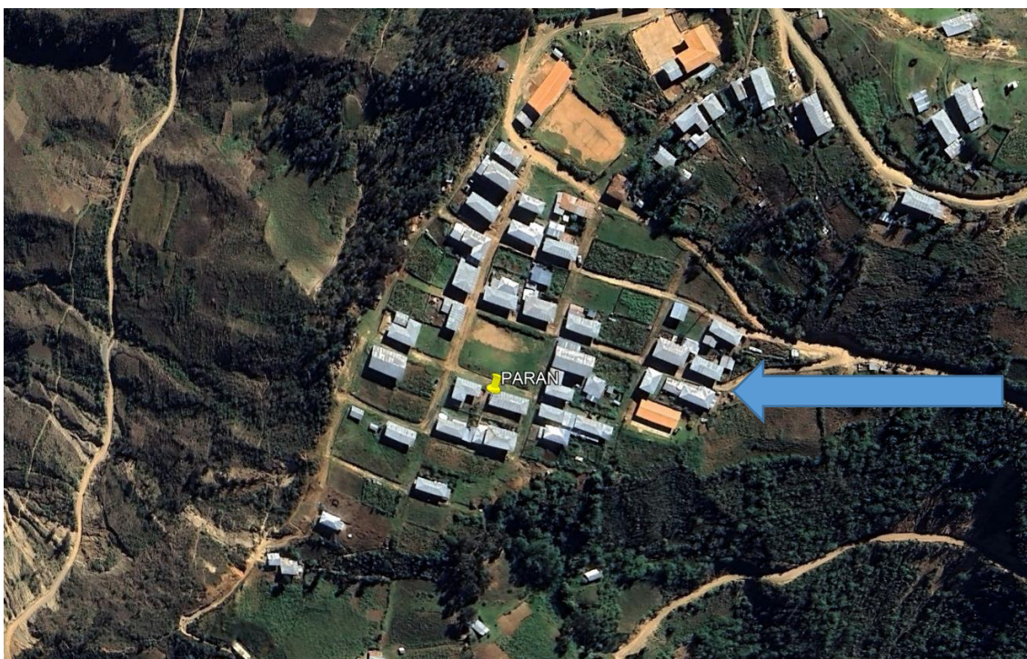
Ubicación Geográfica del lugar donde se proyecta la edificación.

Imagen N° 1: Ubicación y localización (9°10'28.55" N, 76°21'30.00" E)