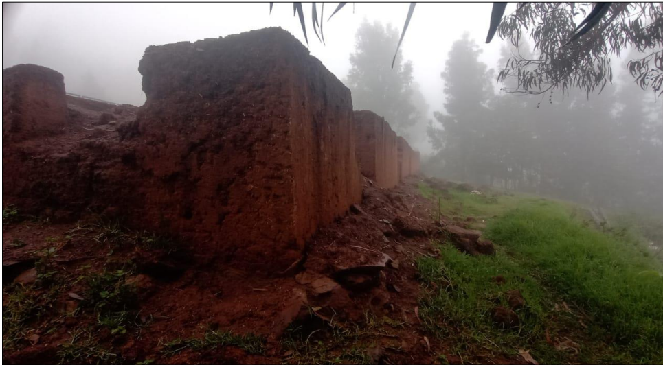
Descripción: Vista de la Estructura Actual