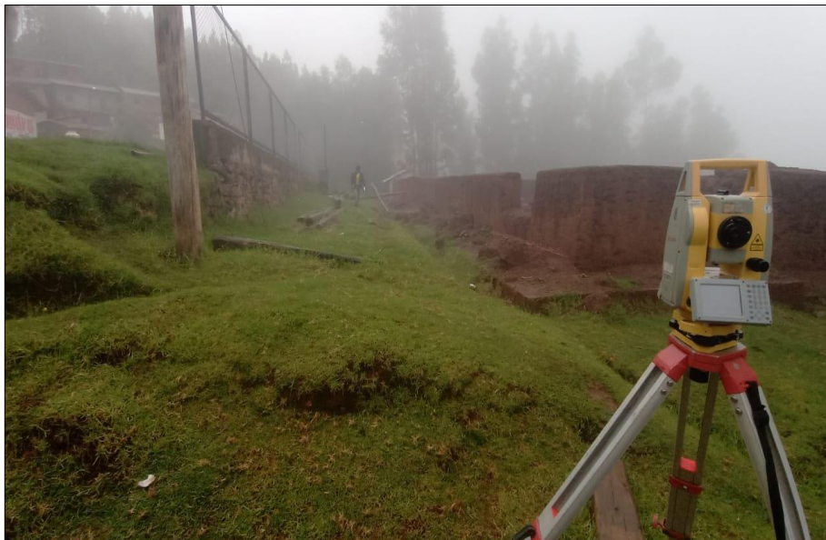
Descripción: Vista desde otro ángulo de la Estructura Actual