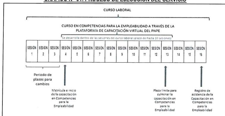
GRÁFICO N° 01: PROCESO DE EJECUCIÓN DEL SERVICIO

El inicio de las sesiones asincrónicas de la capacitación en competencias para la empleabilidad y el taller OPE, iniciará en la cuarta sesión del curso de capacitación laboral, previo a la matrícula en la Plataforma de Capacitación Virtual, por parte del Programa. El plazo para la culminación del curso en competencias para la empleabilidad que tendrá el beneficiario es hasta diez sesiones, tal como se muestra en el gráfico siguiente: