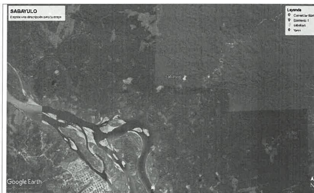
Figura 2: Vista satelital de la Comunidad Nativa sabaluyo.