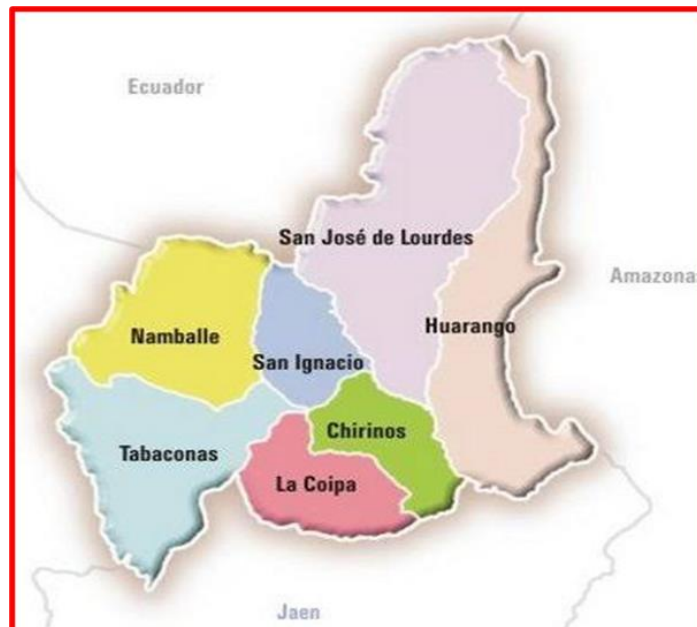
DISTRITO: LA COIPA