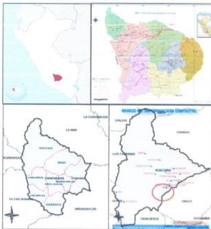
Mapa N° 01: Ubicación política del ámbito del proyecto

Región : Apurímac Provincia : Chincheros Distrito : Huaccana Localidades : Ahuayro, Yanamachay, Sauce Pampa, La Florida, Las Lomas, Gallito de Rocas, Paylahuantuna, Wiraccochapampa, Rosaspampa y Pumayacu.