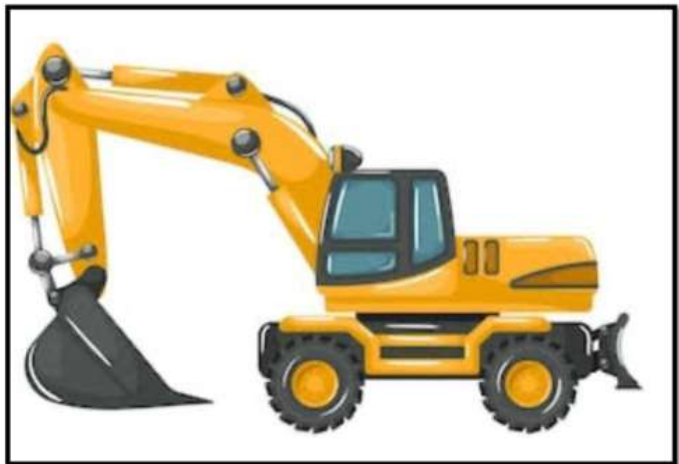
EXCAVADORA CON NEUMATICOS