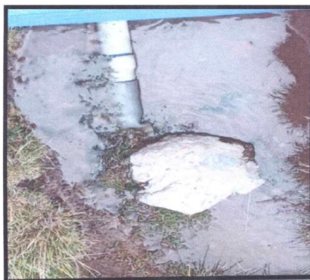
FOTOGRAFIA N° 5 - CAMBIO DE VÁLVULA TIPO GLOBO DE 2 "