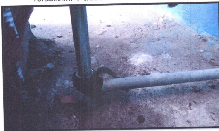
FOTOGRAFIA N° 4 - CAMBIO DE ACCESORIOS SANITARIOS