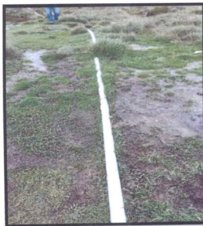
FOTOGRAFIA N° 7 – FALTA ENTERRAR LA TUBERIA DE PVC DE 2" EXPUESTA.