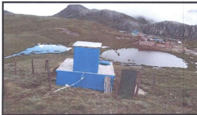
FOTOGRAFIA N° 6 – FALTA ESCALERA DE GATO EN LA PARTE POSTERIOR DEL RESERVORIO.