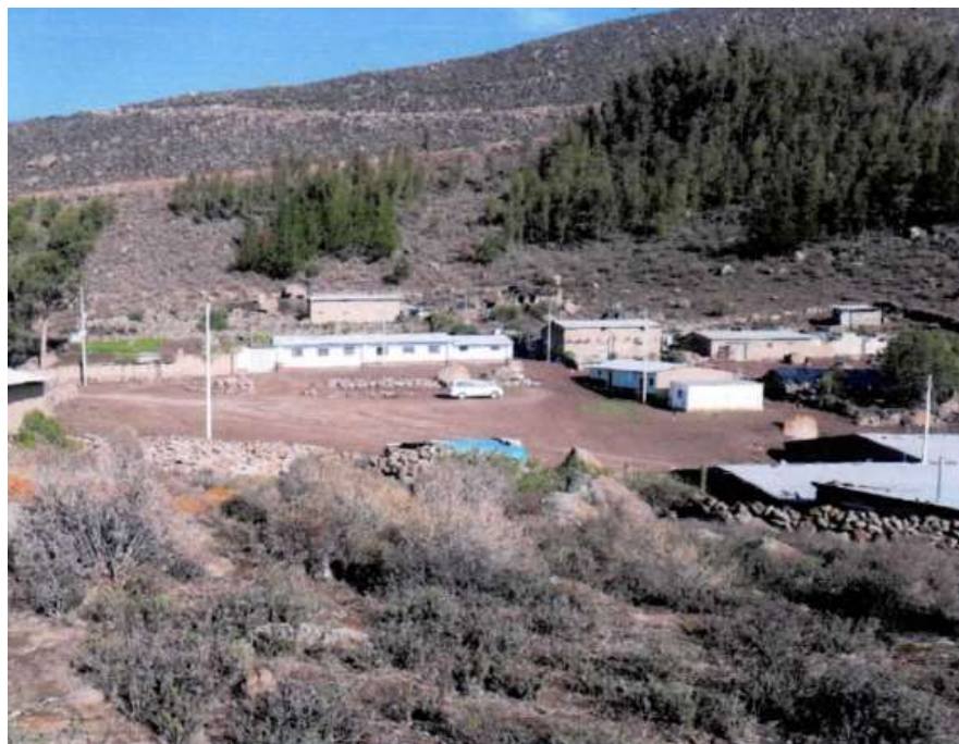
Localidad de Buena Vista.

REGION : AYACUCHO DEPARTAMENTO : AYACUCHO PROVINCIA : LUCANAS DISTRITO : SAISA