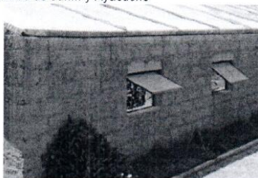
Fotografía referencial de ventana de madera