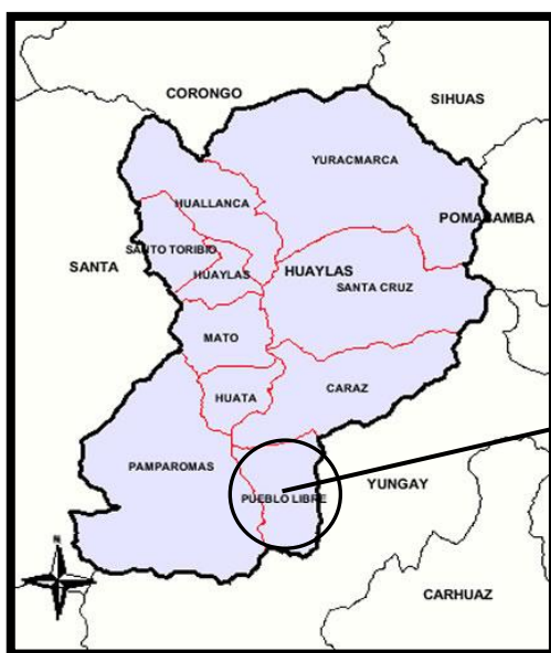
DISTRITO DE PUEBLO