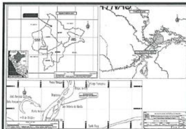
Plano 1. UBICACIÓN DE LA LOCALIDAD DE SAN ANTONIO DE MIRAÑO

"Año del Bicentenario, de la consolidación de nuestra Independencia, y de la conmemoración de las heroicas batallas de Junín y Ayacucho"