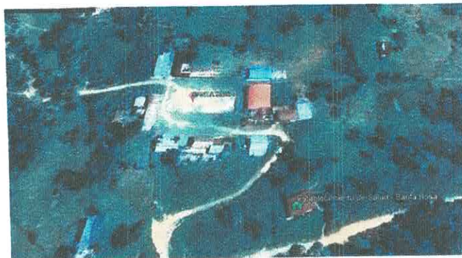
Gráfico N° 01: Ubicación de Establecimiento de Salud de Santa Rosa de la Capilla.

El EE.SS. Santa Rosa pertenece a la jurisdicción de la Dirección Regional de Salud de Cajamarca, DISA-Cutervo y se ubica en la localidad de Santa Rosa.