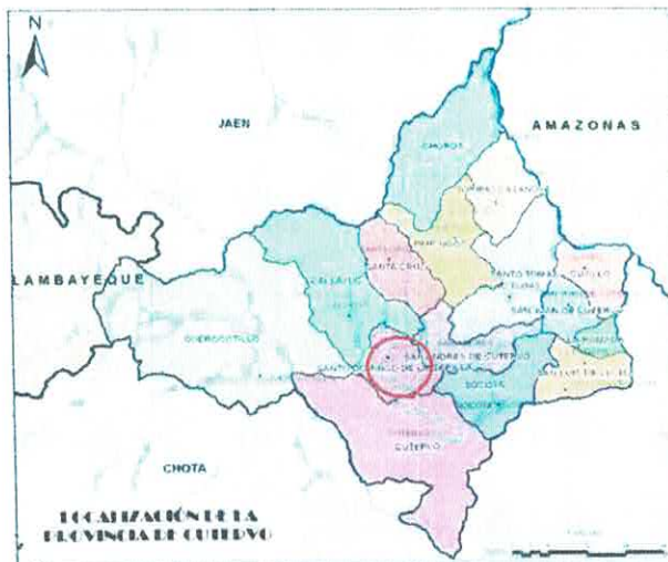
Gráfico N° 02: Localización Geográfica de la Provincia de Cutervo y Distrito de Santo Domingo de la Capilla.