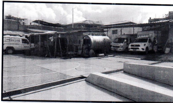
IMAGEN N° 02 Parqueadero de ambulancias Fecha 13/03/2024

"Año del Bicentenario, de la consolidación de nuestra independencia, y de la conmemoración de las heroicas batallas de Junín y Ayacucho"