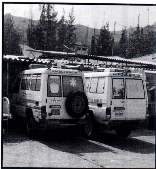
IMAGEN N° 03 Parqueadero inadecuado, cubre solo la mitad de las ambulancias Fecha 13/03/2024