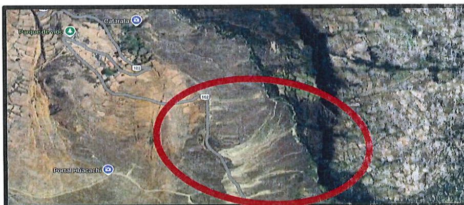
Lugar del proyecto. Google Maps.