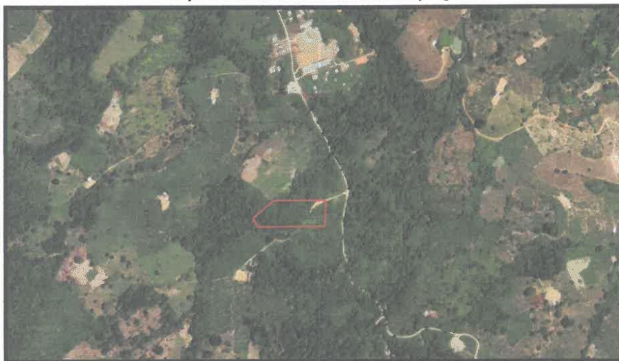
Mapa N° 2 Micro Localización del proyecto