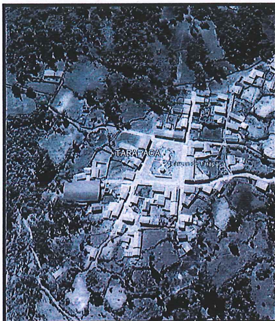
Lugar del proyecto.