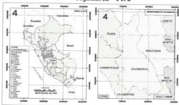
Mapa 01: Ubicación Geográfica: Macrolocalización Departamento Cajamarca – Perú

Barrio : Bajo Rosario Distrito : Celendín Provincia : Cajamarca Región : Cajamarca Ubicación : E: 815789.485 y N: 9240748.08