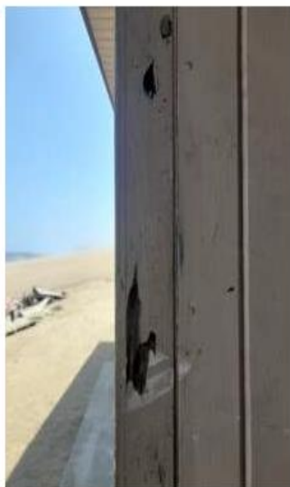
ANEXO 13: Resane de columnas de madera de oficina.