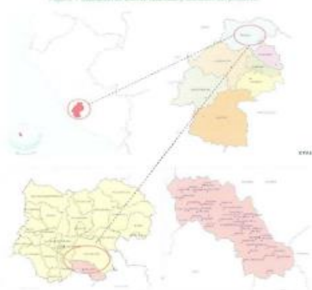
Figura 1 Ubicación de distrito Quichuas y ubicación del proyecto.