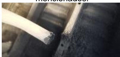
Se evidencia que la línea de escape está incompleta.

NOVENO. - La unidad en mención no cuenta con la línea de escape completo la cual viene comprometiendo el estado de las bocinas de la suspensión posterior por lo que se recomienda realizar la reparación e instalación de la línea de escape (tubo de escape) faltante a fin de que no comprometa con el estado de los componentes antes mencionados.