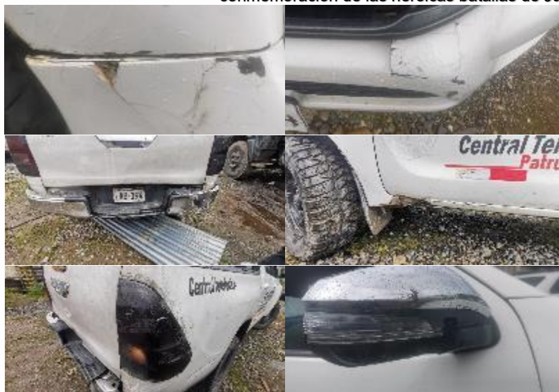
Se evidencia el estado de la carrocería.

"Año del Bicentenario, de la consolidación de nuestra Independencia, y de la conmemoración de las heroicas batallas de Junín y Ayacucho"