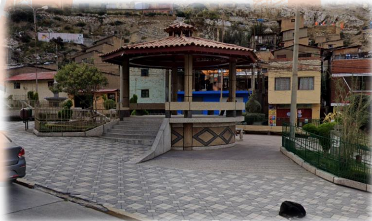
Fig. 4: Situación actual del proyecto