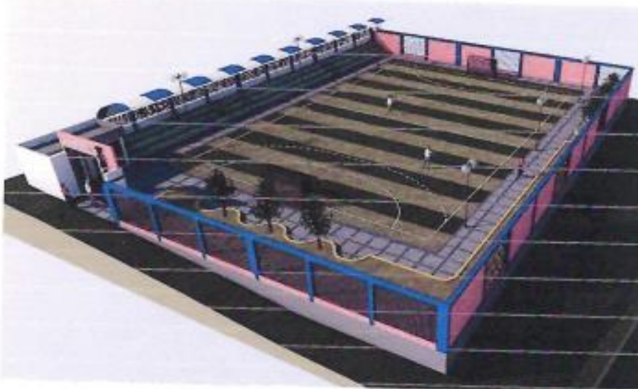
Imágenes 3D de la propuesta arquitectónica del proyecto