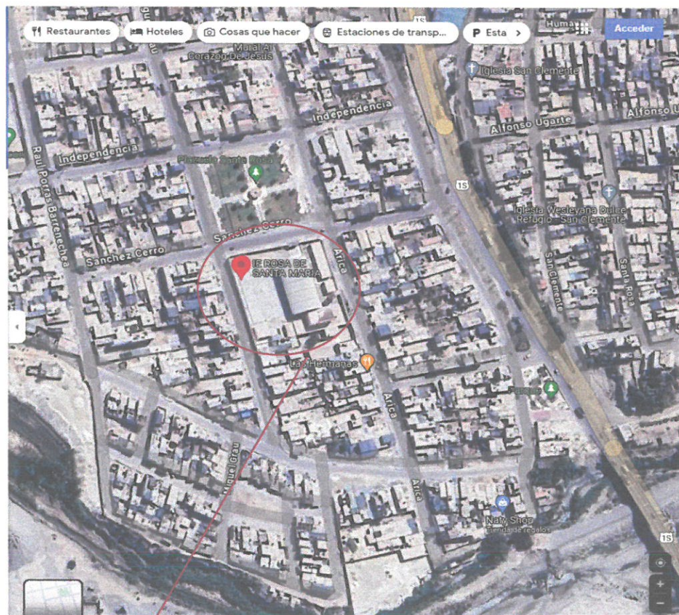
UBICACIÓN DEL PROYECTO DE LA I.E. N°22517 ROSA DE SANTA MARIA