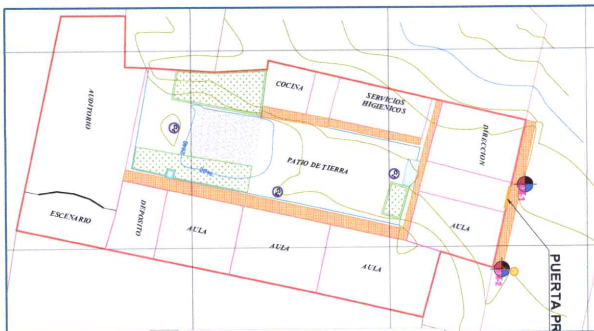
GRAFICO 03: Estructuras existentes de la Institución Educativa N° 237.

Como se indica en el cuadro anterior la institución educativa funciona en los ambientes de una vivienda de material rústico, los ambientes para aula han sido construidos y acondicionados de forma provisional por parte de los padres de familia, no se cuenta la distribución del área reglamentaria para el servicio educativo, los servicios son antiguos e improvisados de material rústico, los aparatos sanitarios están dañados con instalaciones deficientes, el lavadero está en la parte exterior del ambiente acondicionado para servicio higiénico y con los grifos en malas condiciones, el área usado para juegos es sobre terreno natural con presencia de tierra compacta y piedras que en épocas de lluvia se genera lodos que afecta a los alumnos como a los docentes, las puertas y ventanas son de madera y cerrajería metálica que están en malas condiciones