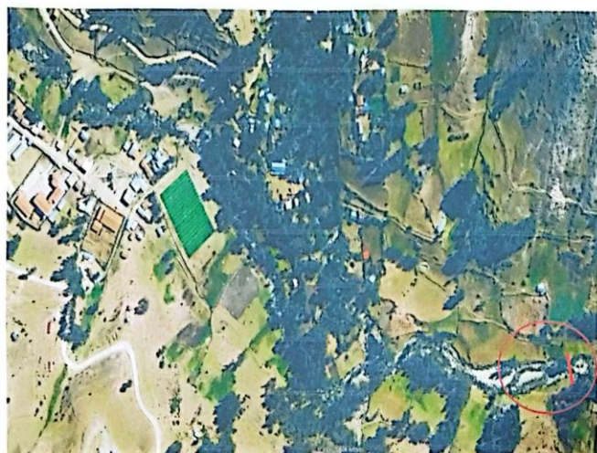
Figura 1: Ubicación de la Localidad de CCOÑANI del Distrito de Vinchos.