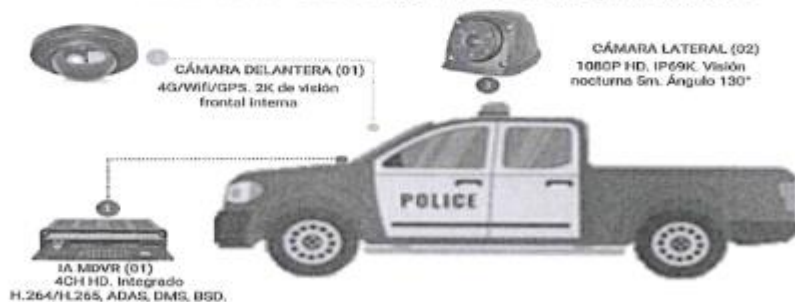
Imagen Referencial del equipamiento

Especificaciones técnicas de la IOARR: Adquisición de Patrulleros y Motocicleta; en Treinta y Cuatro Comisarias PNP tipo A, Comisari: PNP tipo C, Comisarias PNP tipo D, Comisarias PNP tipo E, Comisarias PNP tipo B, a nivel Departamental (San Martín)" con código único: Inversiones N° 2605511